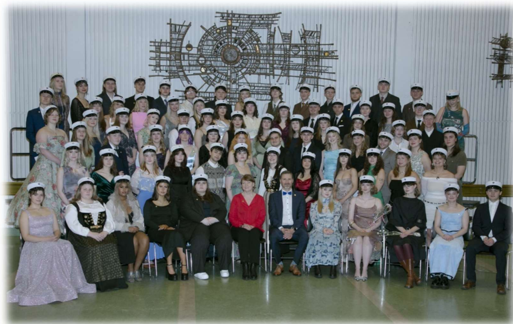
Útskriftarhópur skólans í desember 2023

Fjöldi nemenda í byrjun vorannar 2023 var um 918. Þar af voru eldri nýnemar sem komu úr öðrum skólum 30. Á haustönn var heildarfjöldinn tæplega 1000, þar af 220 nýnemar (10. bekkingar) og 49 eldri nýnemar. Alls voru brautskráðir 236 nemendur á árinu, 155 í maí og 81 í desember. Rúmlega helmingur útskriftarnemenda var á sínu tuttugasta aldursári við útskrift. Alls voru nemendur brautskráðir af 7 námsbrautum. Flestir brautskráðust af opinni braut eða 143 og 33 af náttúrufræðibraut. Að meðaltali lauk hver nemandi 212,5 einingum til lokaprófs og um 63% útskrifaðra lauk náminu á þremur árum eða styttri tíma. Stærstur hluti brautskráðra nemenda var úr Reykjavík eða 138, 44 komu úr Kópavogi en færri úr öðrum sveitarfélögum. Þá er til að taka að fáeinir tugir nemenda úr öðrum framhaldsskólum sækja nám í norsku og sænsku í MH eftir að hefðbundnum skóladegi lýkur. Einnig hafa nemendur úr öðrum skólum fengið að stunda nám í japönsku og kínversku við MH þar sem skólinn er sá eini sem býður upp á slíkt nám í dagskóla. Brotthvarf nýnema, samkvæmt skýrslu unninni af mennta- og barnamálaráðuneyti, var rétt tæp 4%. Ítarlegri nemendatölfræði er að finna í sjálfsmatsskýrslu skólans.