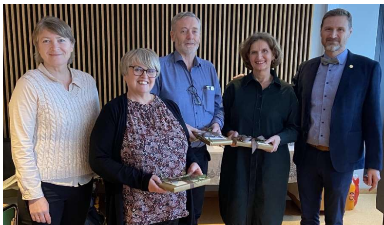
Stjórnendur ásamt tveimur kennurum sem létu af störfum í desember 2023

Alls önnuðust 75 starfsmenn kennslu árið 2023 í u.þ.b. 61 stöðugildi. Vikulegur kennslustundafjöldi í dagskóla var í kringum 1500. Kenndir áfangar eru færri á vorönn þegar færri nemendur stunda nám við skólann en á haustönn. Yfirstjórn skólans mynda rektor, konrektor og áfangastjóri ásamt fjármálastjóra. Námsgreinar og tilheyrandi kennarar skiptast í þrjár deildir: Deild erlendra tungumála, deild samfélagsfræða (félagsgreinar, íslenska og saga) og deild náttúrufræða (raungreinar, íþróttir og stærðfræði). Forsvarsmenn þessara deilda kallast námstjórar og eru þeir í 50% starfi við stjórnun. Aðrir millistjórnendur (í hlutastörfum sem slíkir) á kennslusviði eru IB-stallari og deildarstjóri fjölnámsbrautar (sérnámsbrautar). Tveir starfsmenn annast almenna afgreiðslu á skrifstofu og bókhaldsstörf í samtals 1½ stöðugildi. Náms- og starfsráðgjafar eru þrír í samtals 2,8 stöðugildum, sálfræðingur er í 0,6 stöðugildi og bókasafns- og upplýsingafræðingar eru tveir í 1,8 stöðugildi. Í námsveri skólans starfa þrír kennarar í u.þ.b. tveimur stöðugildum. Skjalastjóri er í 0,5 stöðugildi og persónuverndarfulltrúi í 0,2 stöðugildi. Tveir starfsmenn annast umsjón húsnæðis, tölvu- og tæknimála og matráður sér um mötuneyti starfsfólks ásamt aðstoðarmatráði. Fjórir vinna við ræstingar í u.þ.b. 3 stöðugildum en auk þess sér fyrirtækið iClean um ræstingu á kennslustofum og almennum rýmum skólans. Lítil starfsmannavelta er við skólann og starfsaldur er hár.