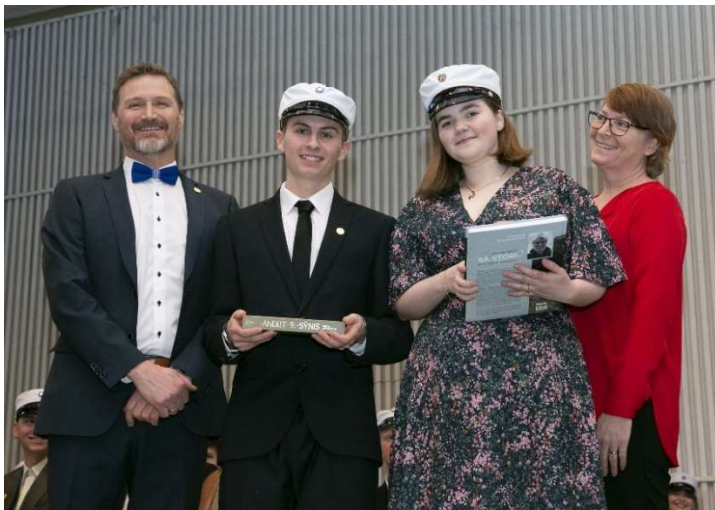
Dúx og semidúx með verðlaun á brautskráningu í desember 2023

Skólinn útskrifar stúdenta af sex brautum: Félagsfræðabraut, málabraut, náttúrufræðibraut, opinni braut, listdansbraut og IB-braut. Haustið 2023 var í fyrsta skipti hægt að velja nýja braut, listmenntabraut, en unnið var að stofnun og undirbúningi hennar á árinu. Á brautinni sérhæfa nemendur sig í listgreinum og velja á milli leiklistar og myndlistar sem aðallistgreinar. Fjölnámsbraut er áttunda brautin þar sem 16 nemendur stunda nám að jafnaði. Nemendur fjölnámsbrautar útskrifast með lokaskírteini um námsferil sinn. IB-brautin er alþjóðleg braut þar sem rúmlega 90 nemendur stunda nám. Nám á henni er skipulagt í samræmi við kröfur IB-samtakanna. Allar brautir skólans, að undanskilinni IB-braut, hafa fengið staðfestingu Menntamálastofnunar.