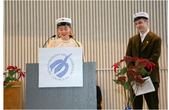
Fulltrúar nýstúdenta halda ávallt ræðu við brautskráningu

Skólinn útskrifar stúdenta af sex brautum: Félagsfræðabraut, málabraut, náttúrufræðibraut, opinni braut, listdansbraut og IB-braut. Fjölnámsbraut er sjöunda brautin þar sem 16 nemendur stunda nám að jafnaði. Nemendur fjölnámsbrautar útskrifast með lokaskírteini um námsferil sinn. IB-brautin er alþjóðleg braut þar sem tæplega 90 nemendur stunda nám. Nám á henni er skipulagt í samræmi við kröfur IB-samtakanna. Allar brautir skólans, að undanskilinni IB-braut, hafa fengið staðfestingu Menntamálastofnunar.