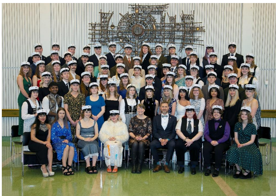
Útskriftarhópur skólans desember 2022

Fjöldi nemenda í byrjun vorannar 2022 var um 980. Þar af voru eldri nýnemar sem komu úr öðrum skólum 37. Á haustönn var heildarfjöldinn rúmlega 1000, þar af 220 nýnemar (10. bekkingar) og tæplega 40 eldri nýnemar. Alls voru brautskráðir 214 nemendur á árinu, 136 í maí og 78 í desember. Rúmlega helmingur útskriftarnemenda var á sínu tuttugasta aldursári við útskrift. Alls voru nemendur brautskráðir af 7 námsbrautum. Flestir brautskráðust af opinni braut eða 119 og 39 af náttúrufræðibraut. Stærstur hluti brautskráðra nemenda var úr Reykjavík eða 132, 32 komu úr Kópavogi en færri úr öðrum sveitarfélögum. Þá er til að taka að fáeinir tugir nemenda úr öðrum framhaldsskólum sækja nám í norsku og sænsku í MH eftir að hefðbundnum skóladegi lýkur. Einnig hafa nemendur úr öðrum skólum fengið að stunda nám í japönsku og kínversku við MH þar sem skólinn er sá eini sem býður upp á slíkt nám í dagskóla. Brotthvarf nýnema, samkvæmt skýrslu unninni af mennta- og barnamálaráðuneyti, var rétt tæp 5%. Þegar árið er skoðað í heild kemur í ljós að nemendur þreyttu próf í 95% þeirra eininga sem þeir voru skráðir í við upphaf annar. Afföllin voru því tæp 5% en þar af má ætla að nær helmingur sé vegna þeirra sem hættu alveg. Ítarlegri nemendatölfræði er að finna í sjálfsmatsskýrslu skólans.