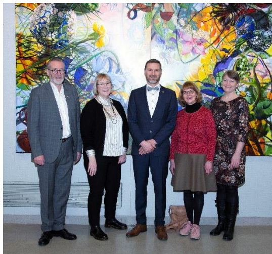
Stjórnendur ásamt tveimur kennurum sem létu af störfum í desember 2022

Alls önnuðust 85 starfsmenn kennslu árið 2022 í rúmlega 75 stöðugildum. Vikulegur kennslustundafjöldi í dagskóla var að jafnaði 1500-1600 talsins. Kennslustundirnar eru ætíð færri á vorönn þegar færri nemendur stunda nám við skólann en á haustönn. Yfirstjórn skólans mynda rektor, konrektor og áfangastjóri ásamt fjármálastjóra. Námsgreinar og tilheyrandi kennarar skiptast í þrjár deildir: Deild erlendra tungumála, deild samfélagsfræða (félagsgreinar, íslenska og saga) og deild náttúrufræða (raungreinar, íþróttir og stærðfræði). Forsvarsmenn þessara deilda kallast námstjórar og eru þeir í 50% starfi við stjórnun. Aðrir millistjórnendur (í hlutastörfum sem slíkir) á kennslusviði eru IB-stallari og deildarstjóri fjölnámsbrautar (sérnámsbrautar). Tveir starfsmenn annast almenna afgreiðslu á skrifstofu og bókhaldsstörf í samtals 1½ stöðugildi. Náms- og starfsráðgjafar eru þrír í samtals 2,8 stöðugildum, sálfræðingur er í 0,8 stöðugildi og bókasafns- og upplýsingafræðingar eru tveir í 1,8 stöðugildi. Í námsveri skólans starfa þrír kennarar í u.þ.b. tveimur stöðugildum. Skjalastjóri er í 0,5 stöðugildi og persónuverndarfulltrúi í 0,2 stöðugildi. Þrír starfsmenn annast umsjón húsnæðis, tölvu- og tæknimála og matráður sér um mötuneyti starfsfólks ásamt aðstoðarmatráði. Fjórir vinna við ræstingar í u.þ.b. 3 stöðugildum en auk þess sér fyrirtækið iClean um ræstingu á kennslustofum og almennum rýmum skólans.