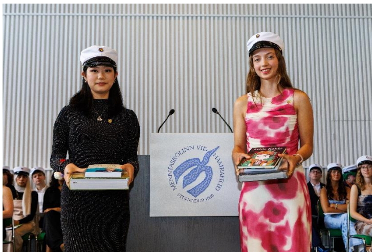
Mynd 1 Dúx og semidúx skólans vorið 2025

IB-brautin hefur stækkað mikið eftir að við bættum við einum bekk í Pre-IB-námið sem er undirbúningur undir IB-námið. Haustið 2025 voru 127 nemendur á brautinni, þ.e. 48 nemendur á Pre-IB og 79 á IB1 og IB2. Nám á brautinni er skipulagt í samræmi við kröfur IB-samtakanna.