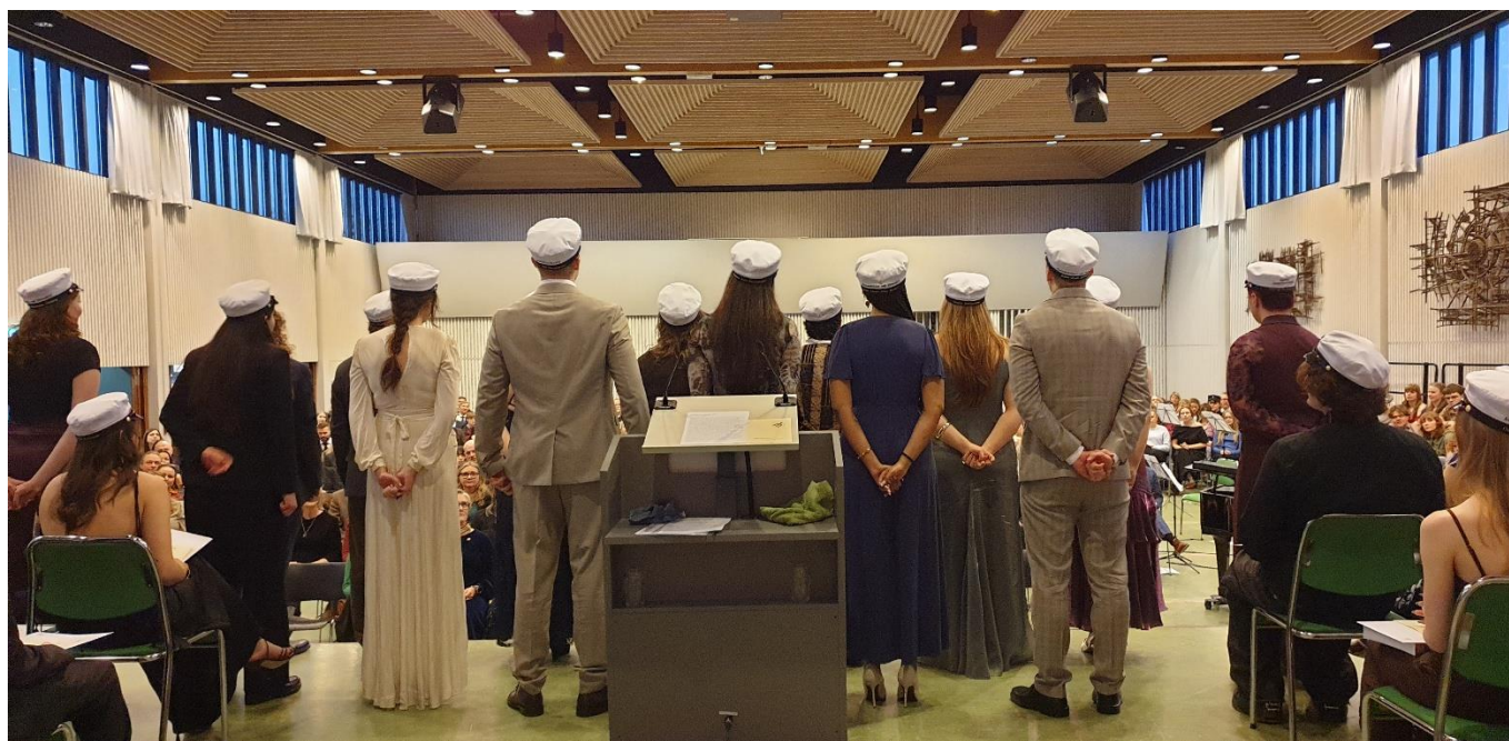
Brautskráðir MH-ingar á leið út í lífið.